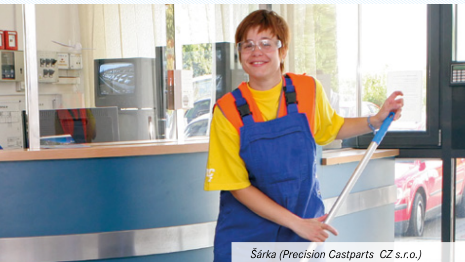
Šárka (Precision Castparts CZ s.r.o.)