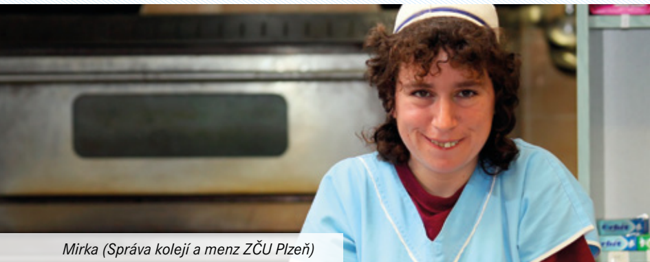
Mirka (Správa kolejí a menz ZČU Plzeň)